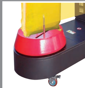
Basamento con blocco meccanico Turntable with mechanical brake