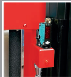
Fotocellula lettura valigia Photoeye to detect luggage height