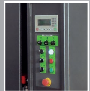
Pannello di controllo lcd alfanumerico Lcd control panel