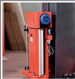
Carrello con prestiro motorizzato fisso Pre-stretch film carriage